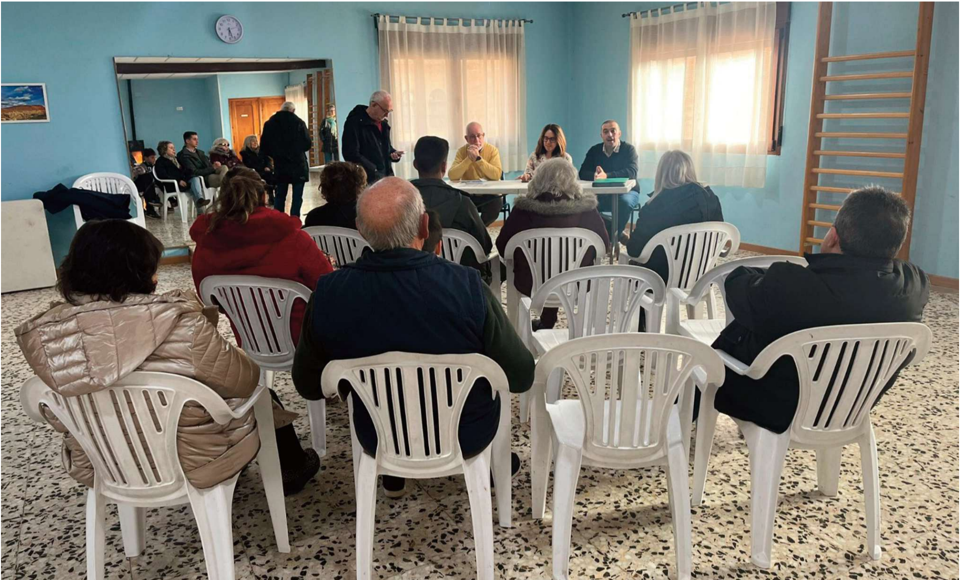
Imagen de una de las tres presentaciones que se realizaron este sábado, en concreto la de Celadas