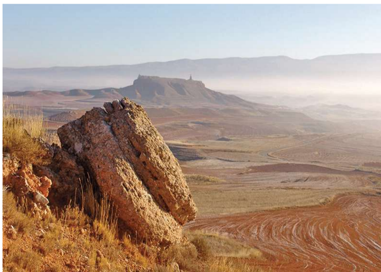
Imagen de la postal dedicada al Castillo de Alfambra junto a su sello correspondiente, donde se ve el aljibe de la fortaleza

Además del valor sentimental que puedan tener los sellos para aquellas personas vinculadas a cada pueblo, o el precio para un coleccionista que depende de la oferta y de la demanda, los nuevos sellos de la serie Castillos de Aragón tienen valor oficial para envío postales a través de Correos. En concreto estos tres sellos con los castillos de Camañas, Alfambra y Celadas, tienen un valor tipificado como A, “lo que significa que ahora